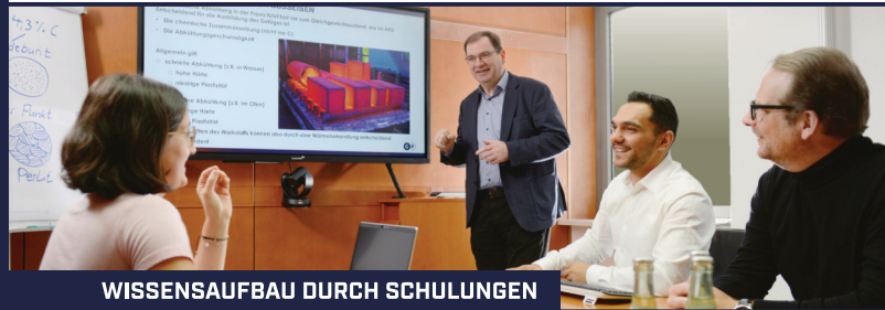
WISSENSAUFBAU DURCH SCHULUNGEN